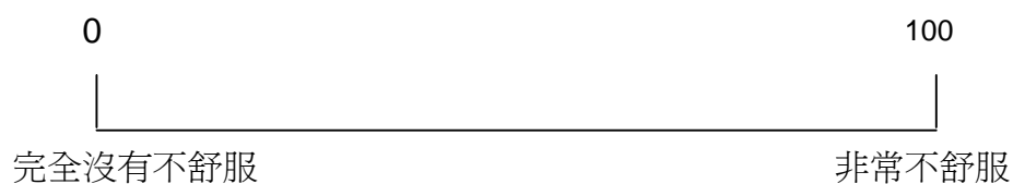
圖一：整體健康狀態 (General Health Status)